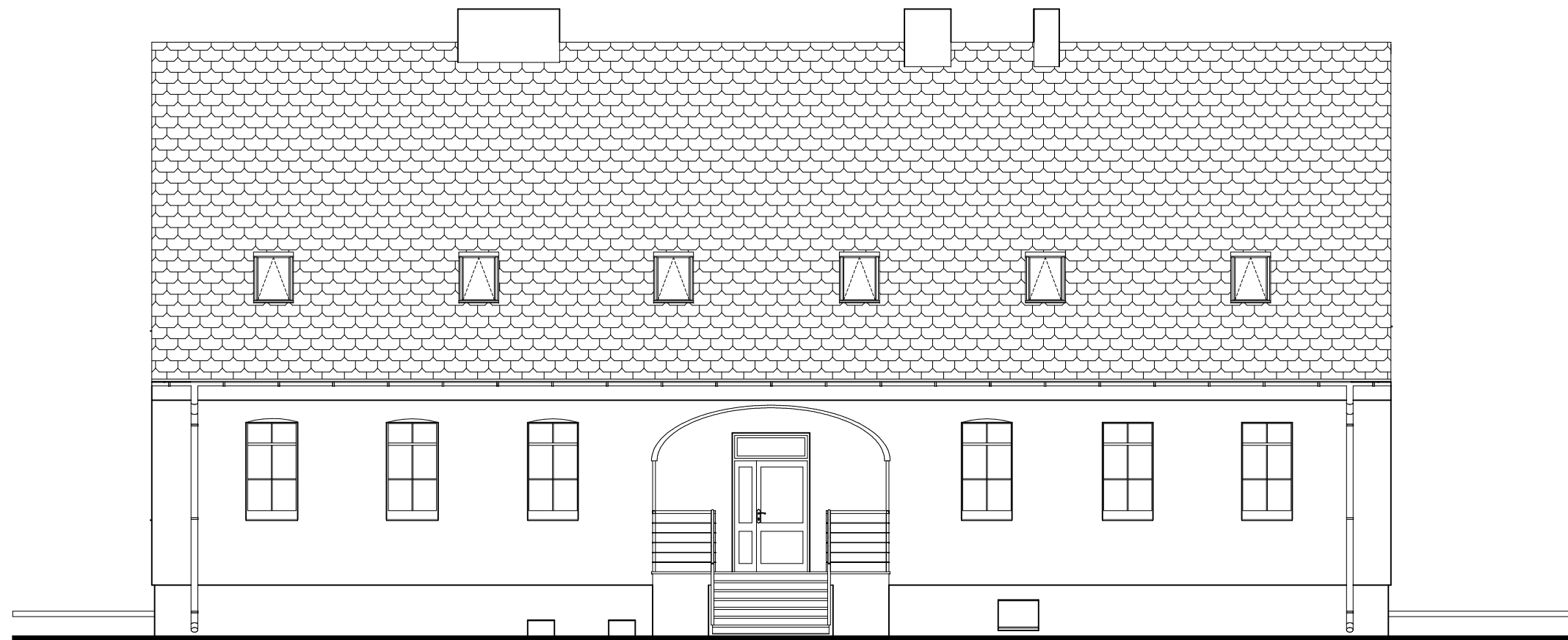
ELEWACJA POŁUDNIOWO - WSCHODNIA