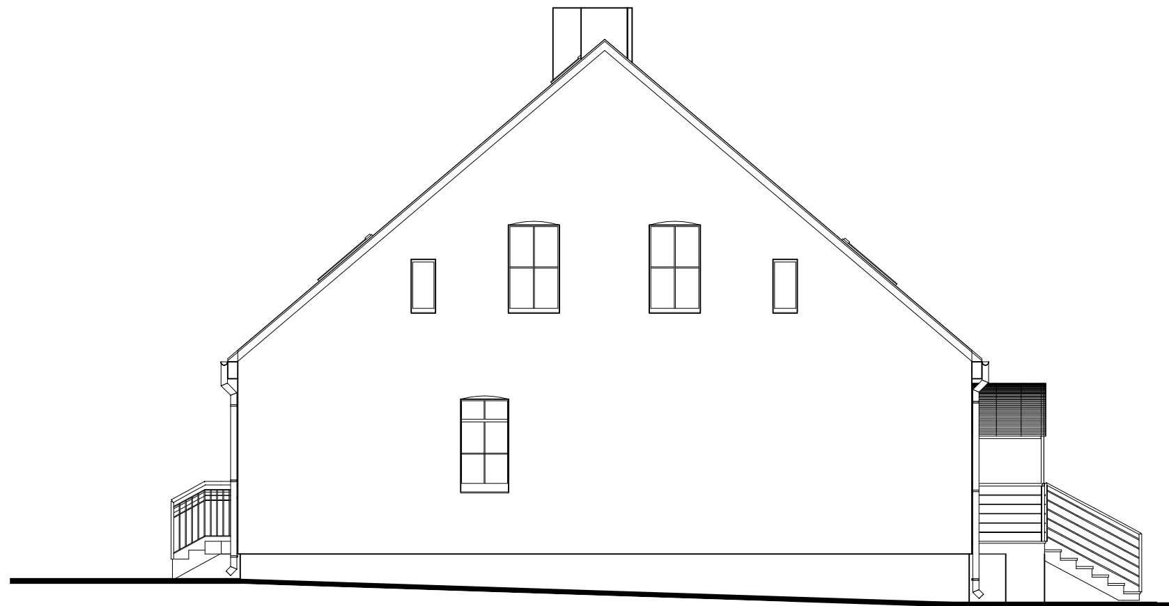
ELEWACJA POŁUDNIOWO - ZACHODNIA