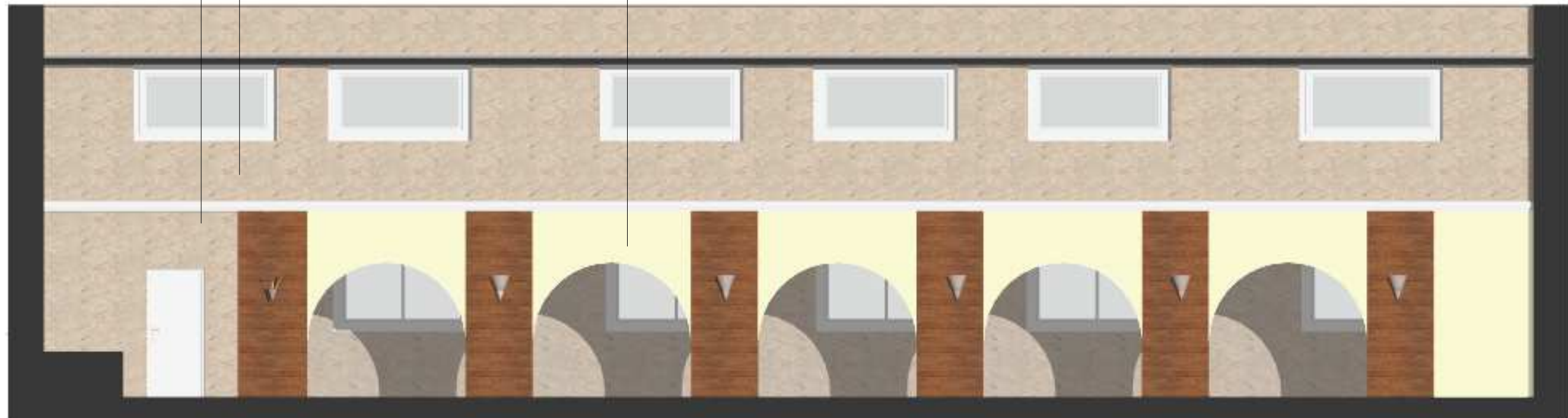
WIDOK ŚCIANY - KOLORYSTYKA

gzyms styropianowy malowany w kolorze białym