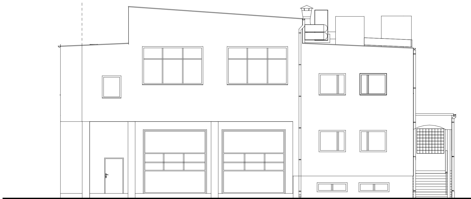
ELEWACJA PÓŁNOCNO - WSCHODNIA