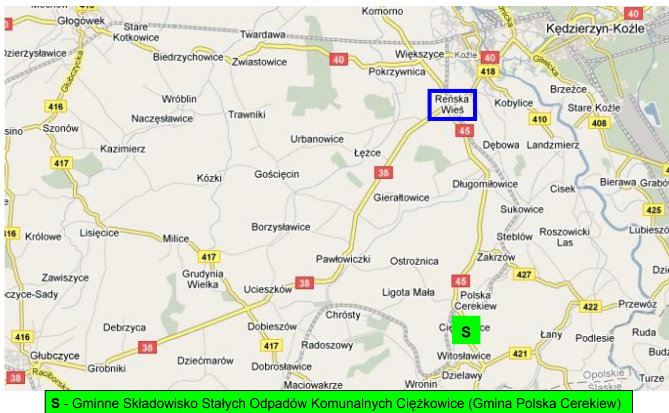
Rysunek nr 2. Mapa lokalizacyjna składowiska odpadów