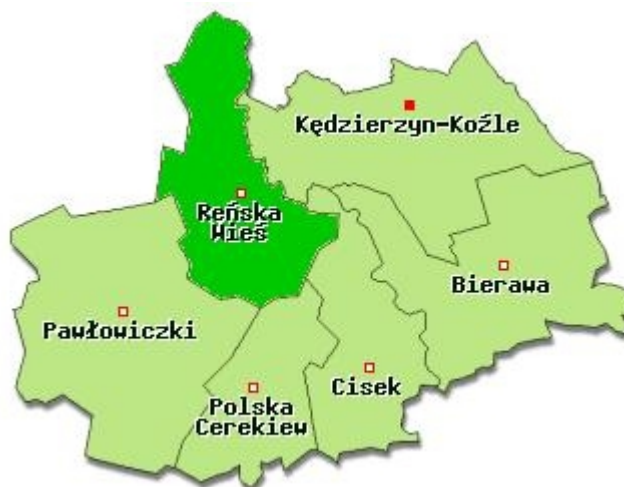
Rysunek nr 1. Położenie Gminy Reńska Wieś

Pod względem organizacyjnym gmina obejmuje 15 sołectw: Bytków, Dębowa, Długomiłowice, Gierałtowiec, Kamionka, Komorno, Łężce, Mechnica, Naczysławki, Poborszów, Pociękarb, Pokrzywnica, Radziejów, Reńska Wieś, Większyce.